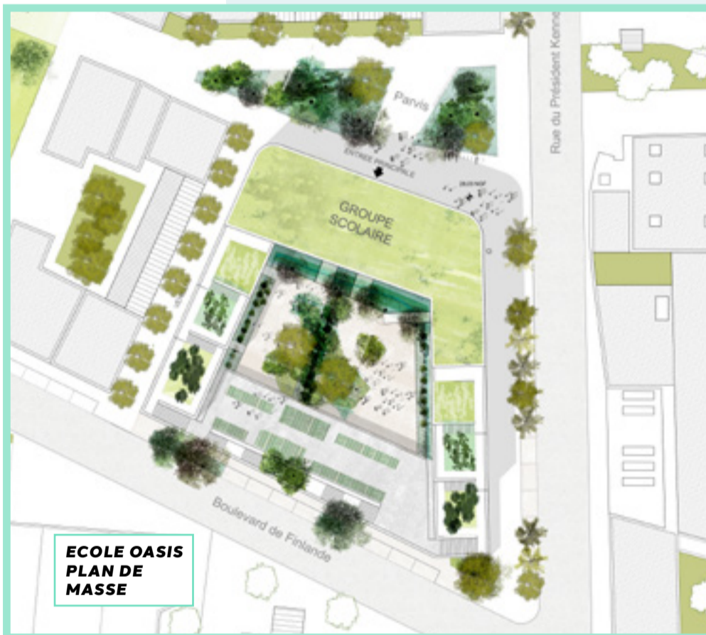
ÉCOLE OASIS PLAN DE MASSE