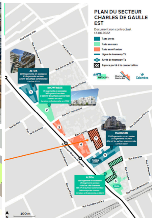
ZAC Charles de Gaulle Est éCO.urbain