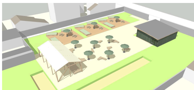
Vue de C2Mains à l'été 2024 - YA+K