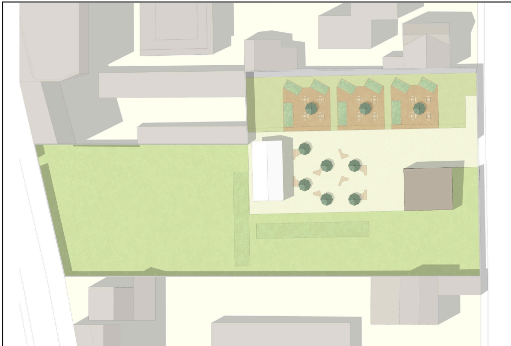
Plan de l'îlot pour l'été 2024 - Ya+K